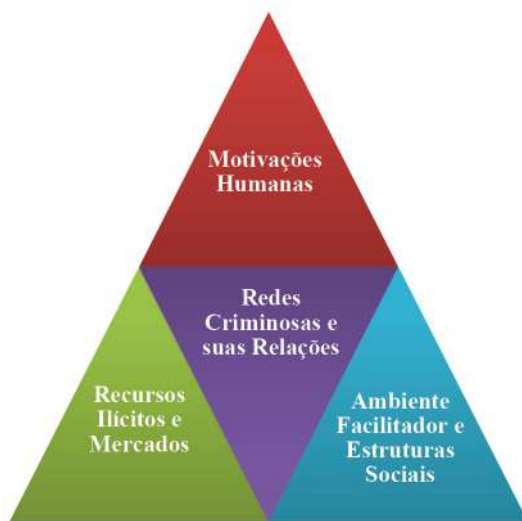
Figura 2 – Tetraedro das Organizações Criminosas Transnacionais

A compreensão das OCT por meio da metáfora do Tetraedro do Fogo, portanto, permite identificar quatro domínios fundamentais que sustentam e perpetuam suas atividades: os recursos e mercados ilícitos, o ambiente social facilitador, os desejos e motivações humanas e as redes criminosas e a sua capacidade adaptativa. Como anteriormente apresentado, esses domínios são interdependentes e recursivos, influenciando-se mutuamente de maneira contínua, sem os quais as atividades criminosas deixam de existir.